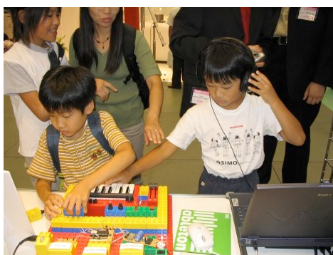
Abbildung 1: Stekgreif ermöglicht kinderleichte Bedienung

Stekgreif ist ein 2003 im Rahmen des „Jugend forscht“-Wettbewerbs entwickelter MIDI-Controller, bei dem einzelne Regler als auf einer Grundplatte frei anzuordnende Module realisiert sind. Dabei wurde auf das Lego-Duplo System zur Herstellung der Module und der Grundplatte zurückgegriffen.