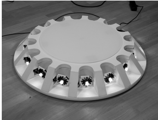
Abbildung 1: Hardware Maskenrad, Trittfläche und bewegbare RGB LEDs